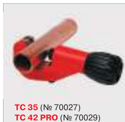
ТС 35 (№ 70027) ТС 42 PRO (№ 70029)