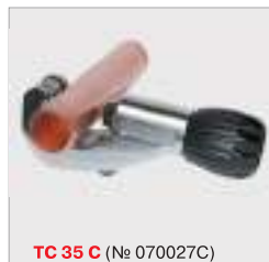
ТС 35 C (№ 070027C)