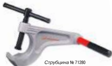
Струбцина № 71280

Можно использовать также в комбинации с устройством для накатки желобков!