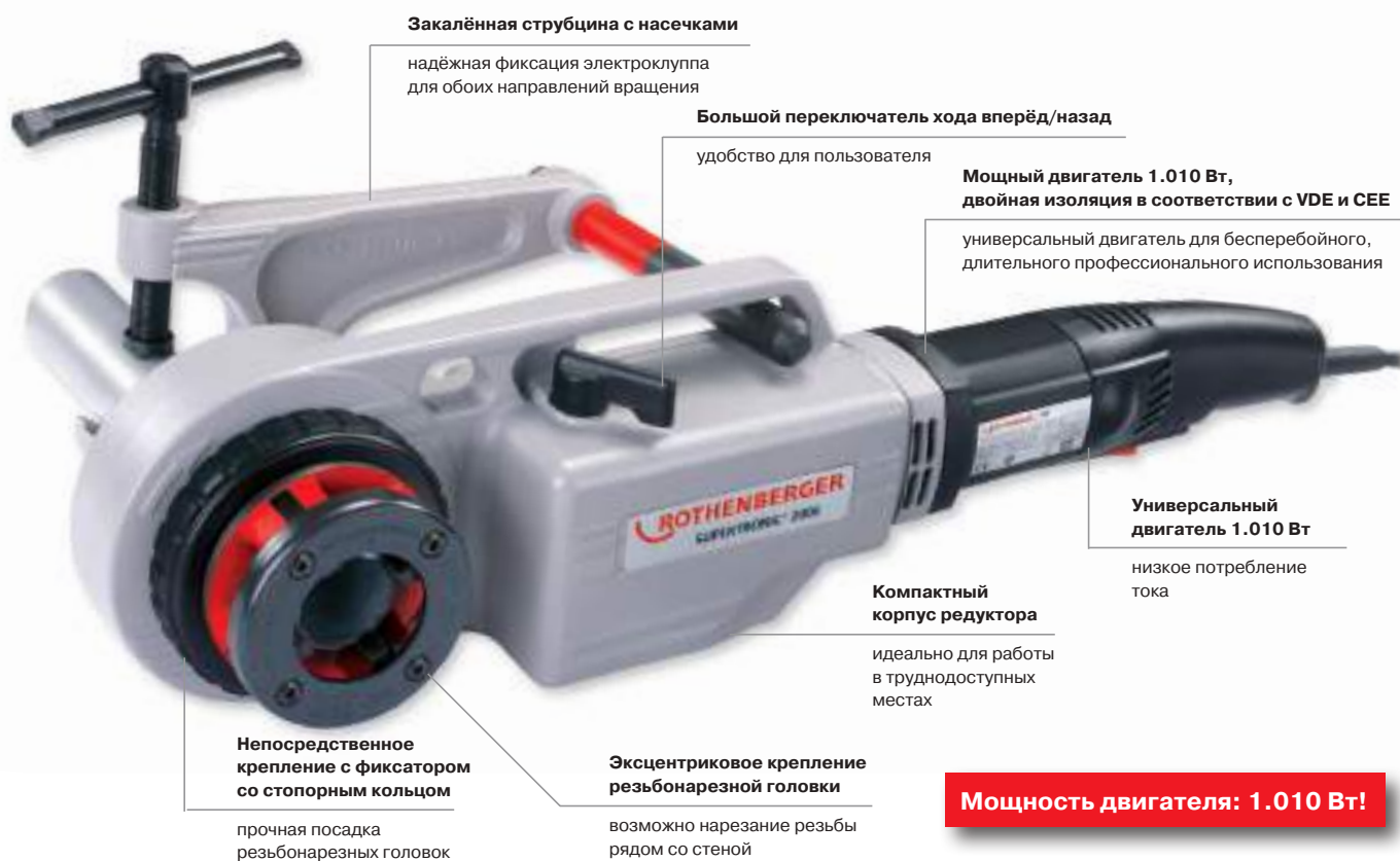
Лёгкая установка резьбонарезных головок